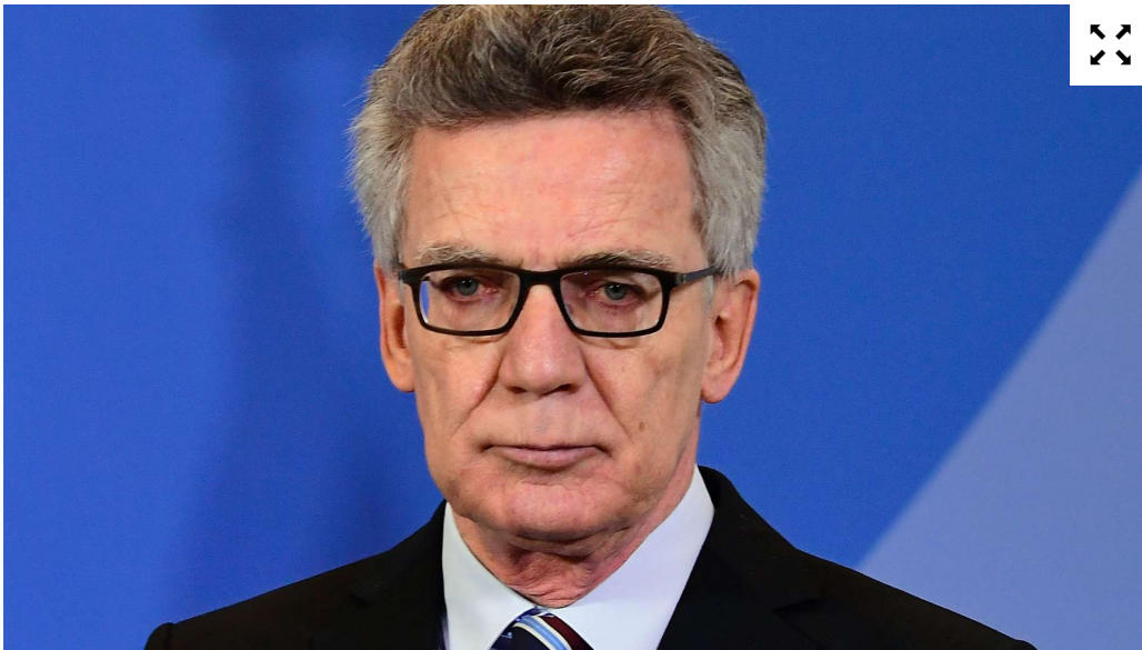
Innenminister Thomas de Maizière.