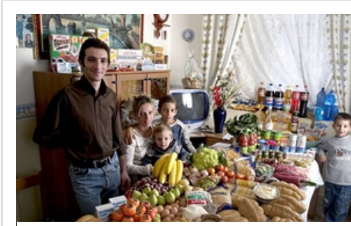
Dünya ne yiyor?