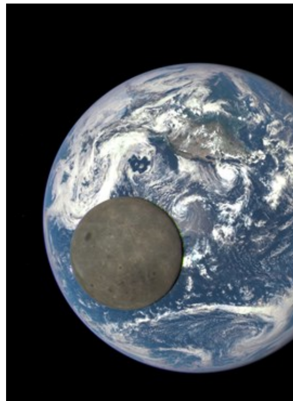
Quand la lune croise le chemin de la Terre